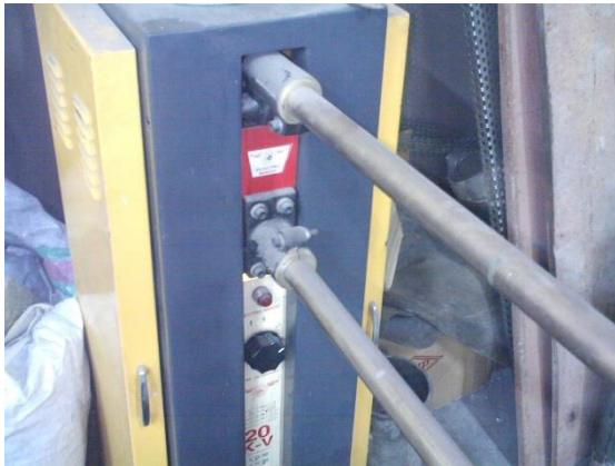
شکل ۴: دستگاه جوش نقطه ای