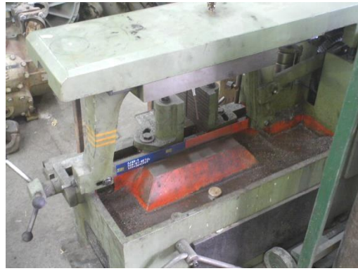
شکل ۷: دستگاه اره لنگ