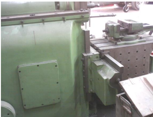
شکل ۶: دستگاه صفحه تراش