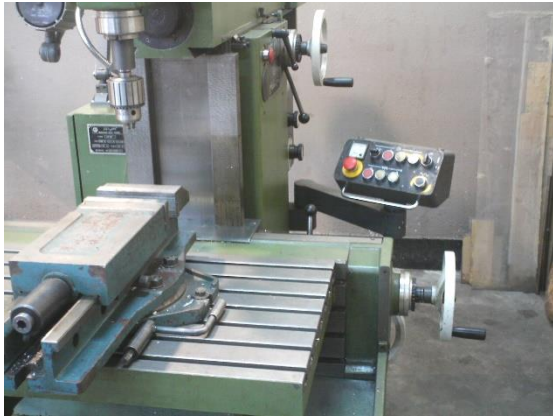
شکل ۲: دستگاه فرز