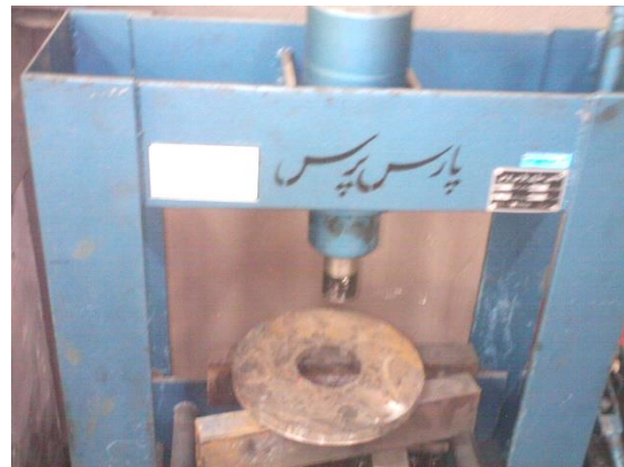
شکل ۳: دستگاه پرس هیدرولیکی ۱۵ تنی