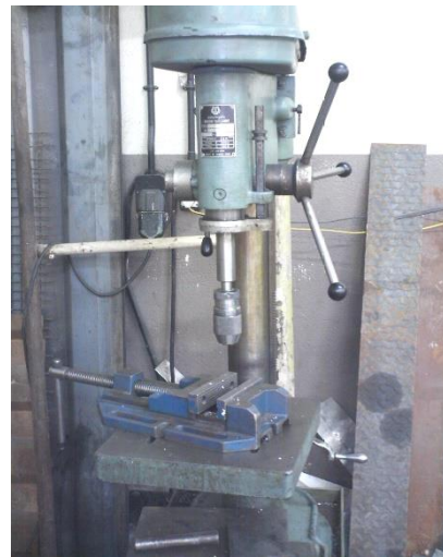
شکل ۵: دستگاه دریل