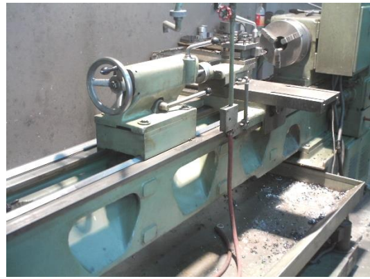
شکل ۱: دستگاه تراش