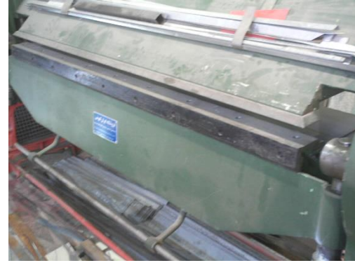
شکل ۹: دستگاه خم